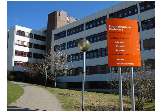
Emil-Figge-Str. 44

So erreichen Sie den Veranstaltungsort mit der Bahn: